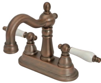
MA499L4 Matilda 4 インチ混合栓 ハーデン・ネオ