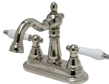
MA500L4 Matilda 4 インチ混合栓 アルティメット・ハーデン